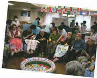
待ちに待った年に1度の運動会。 チームで一致団結! 笑顔が絶えないイベントです。