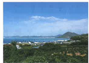
楽生苑がある瀬戸内海に浮かぶ「生口島」。レモン等の柑橘系の栽培が盛んで、サイクリストの聖地としても知られている。

楽生苑はこんなところ 楽生苑が目指す介護は、「できることは自分で」「家族のように毎日過ごす」ということです。加齢や持病により今までできなかったことができなくなる中でも、今までと変わらない生活がしたい、自分のことは自分でしたい、という思いに添えるため、ホテルのような非日常ではなく、「日常の延長」で接することに重きを置いています。また、地域との繋がりを大切にしている点も楽生苑の特徴です。誰もが気軽に立ち寄れたり、安心して相談できる場所でありたいという思いから、ボランティアの積極的な受け入れや、地元住民の方も参加いただけるイベントを開催しています。