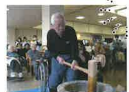
年末恒例餅つき!入居者・スタッフ力を合わせて美味しいお餅ができました。