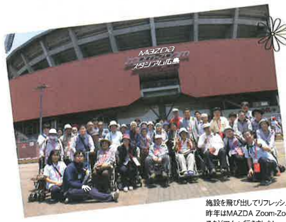
施設を飛び出してリフレッシュ! 昨年はMAZDA Zoom-Zoom スタジアムへ行きました!