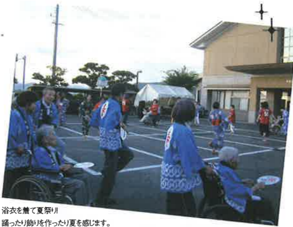
浴衣を着て夏祭り! 踊ったり飾りを作ったり夏を感じます。