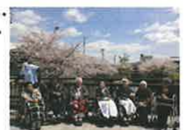
春といえば桜、桜といえばお花見!近くのお花見スポットで桜を満喫。